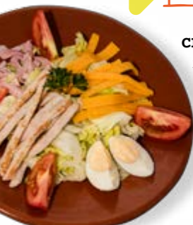
Ensalada del Chef