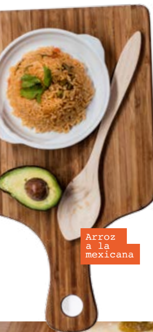
Arroz a la mexicana