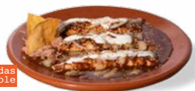
Enchiladas de mole